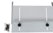
Työtaso + pussipidin: OTST 621 1111145