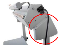
Kulmakappale jalustaan AD MGMI 1111149