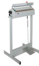
Jalusta : SP 421 sis. mek.poljin 1111169