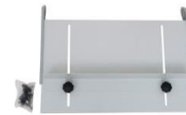
Työtaso + pussipidin: OTST 421 1111144