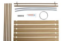
Huolto / varaosasarja: MG / MGM 365-1201