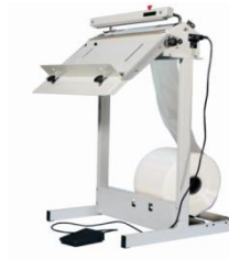
Varustepaketti : AS 421 MG (sisältää: OTST + SP + SR) 1111174