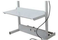
Hyllytaso jalustaan: BS 421 MGMI