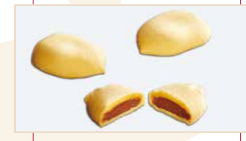
19. Goccia, ripiena cioccolato