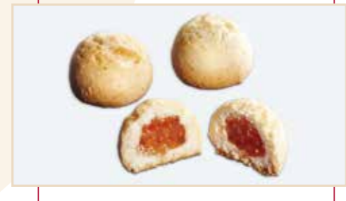
16. Frollino ripieno marmellata