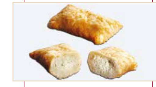
23. Tronchetto salato, ripieno