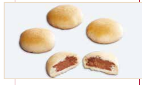
13. Frollino ripieno nutella