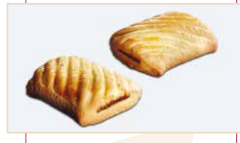
14. Frolla stampata a rullo, ripieno fichi