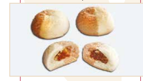
17. Frollino bicolore, ripieno marmellata