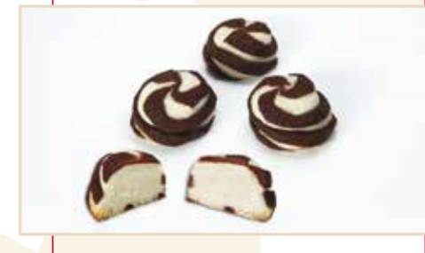
7. Roll taglio a diaframma