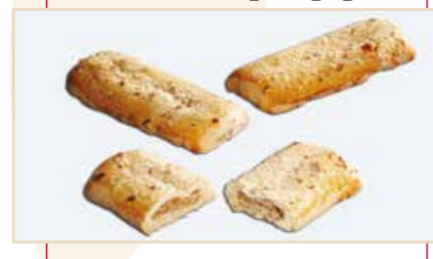
22. Barretta nocciole, taglio a ghigliottina