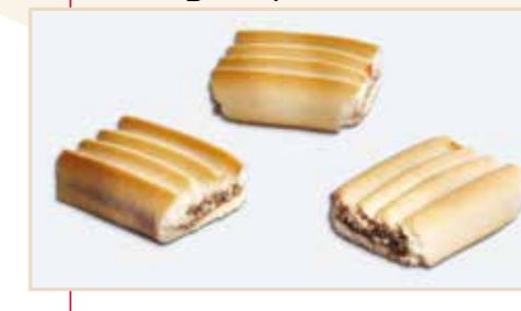
8. Frolla rigata ripieno datteri