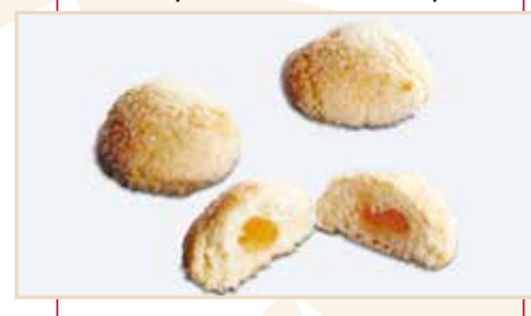
18. Biscotto pasta di mandorle ripiena