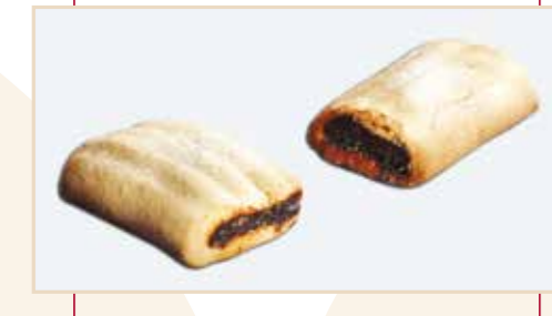
15. Frollino stampato a rullo, ripieno prugna