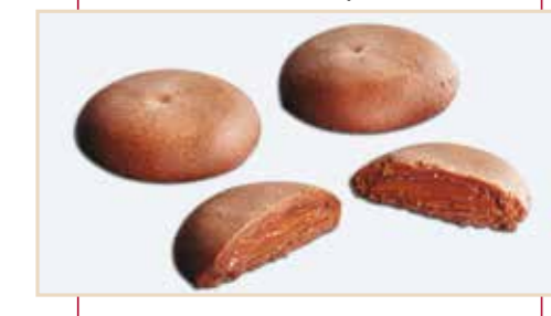
21. Frollino cioccolato, ripieno nutella