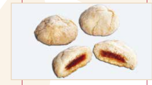
20. Amaretto ripieno